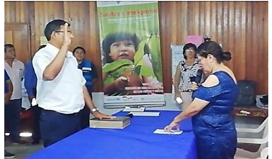
Juramentación de la Instancia Provincial de violencia contra la mujer – Prov. Ramón Castilla.